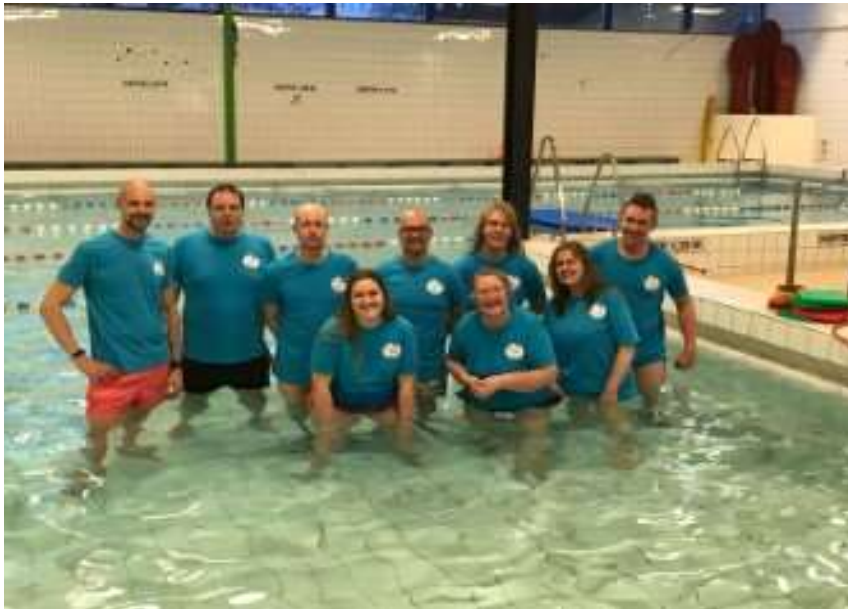
Het team van lesgevers.