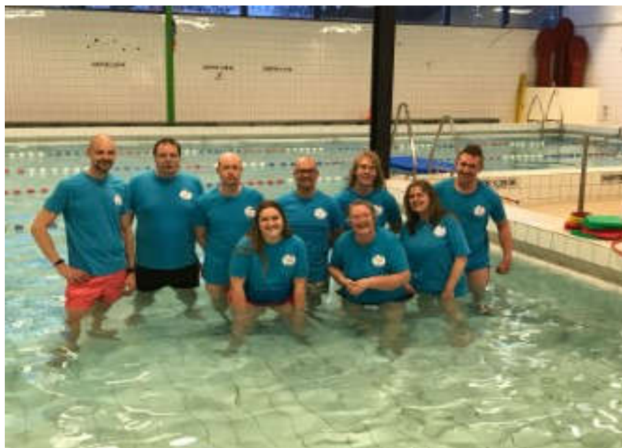
Het team van lesgevers.